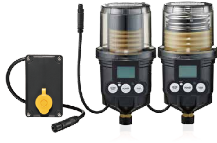
Modelle PULSARLUBE Mi 60 & 125ml

Automatischer Schmierstoffgeber mit einem Schwingungssensor.