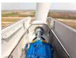
· Trasmissione Industriale