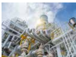
· Serbatoio Idraulico