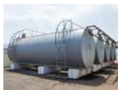
· IBC e Serbatoio del Liquido