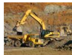
· Attrezzature Mobili