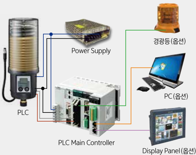
MONTH TYPE, INTERVAL TYPE 공통적용